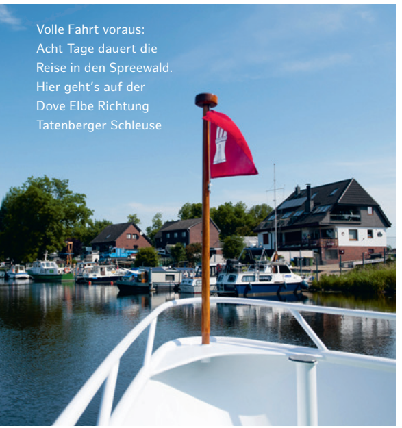
Volle Fahrt voraus: Acht Tage dauert die Reise in den Spreewald. Hier geht's auf der Dove Elbe Richtung Tatenberger Schleuse